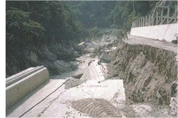
▲災害時 上矢作町達原・達原トンネル