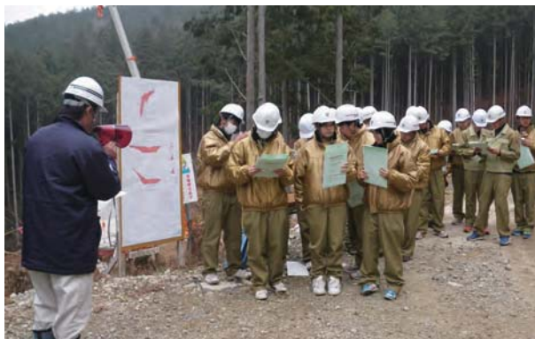
高校生建設現場見学会(現場見学)