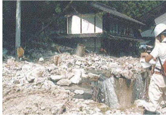
▲災害時 上矢作町達原・犬間沢