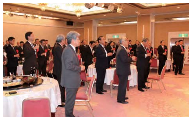
恵那峡グランドホテル