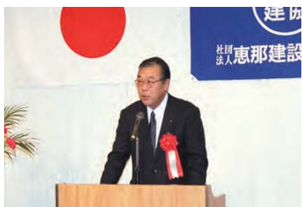
岐阜県議会議員 早川 捷也様