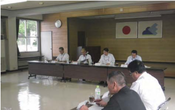
恵那土木事務所と恵那建設業協会との意見交換会