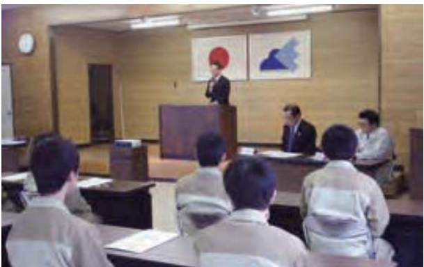
高校生建設現場見学会(開会式) (中津川工業高校 建設工学科)