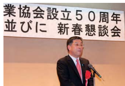
岐阜県議会議員 水野 正敏様