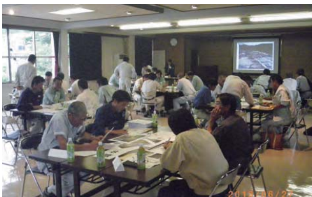
危険予知・リスクアセスメント研修会