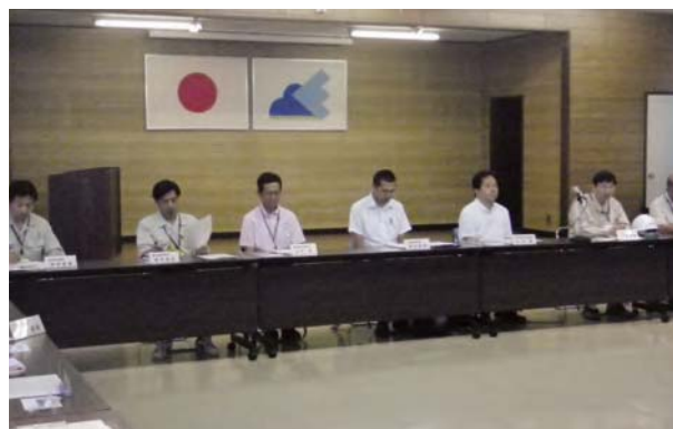
安全パトロール(出発式)