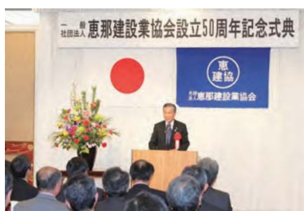
恵那市長 可知 義明様