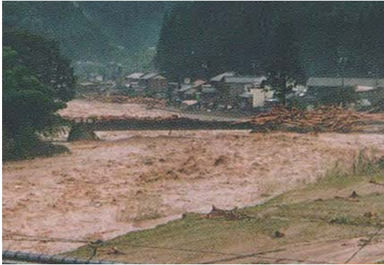
▲災害時 上矢作町本郷弁天橋付近・川上村