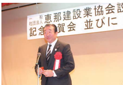
岐阜県議会議員 平岩 正光様