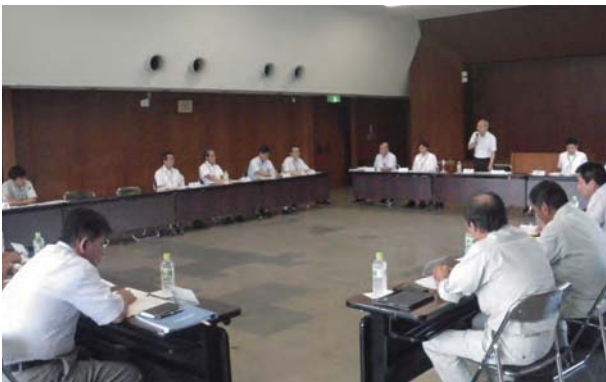
県土整備部と恵那建設業協会との意見交換会