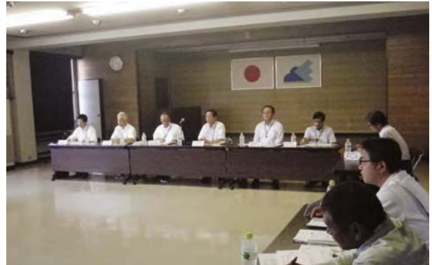
恵那農林事務所と恵那建設業協会との意見交換会