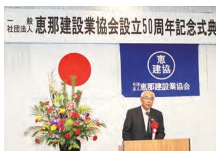
中津川市長 青山 節児様