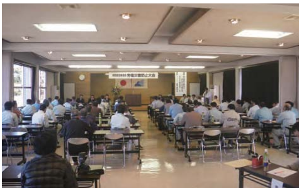
労働災害防止大会