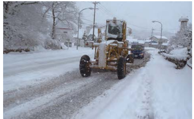
除雪作業 恵南地区